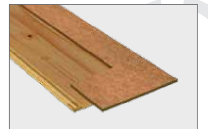
Understruktur med HDF plate.

Lengde: 2200 mm Bredde: 209 mm m 2 pr. bord: 0,46 m 2 Antall bord pr. pk.: 4 m 2 pr. pk.: 1,84 m 2 Pk. pr. palle: 40 m 2 pr. palle: 73,60 m 2 Vekt pr. palle: 766,80 kg